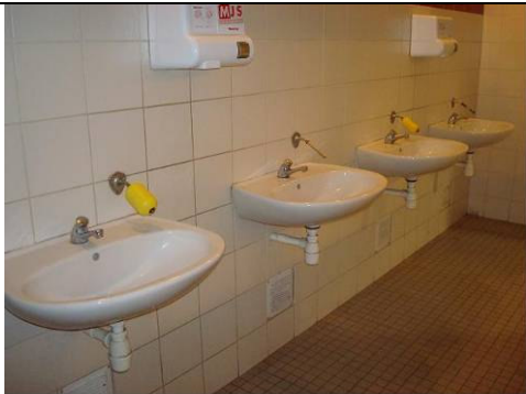
sèche mains inaccessible