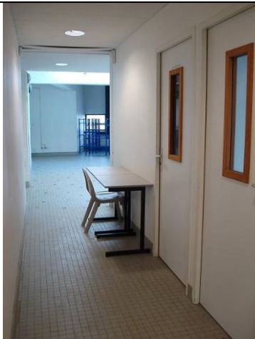
Portes salles annexes