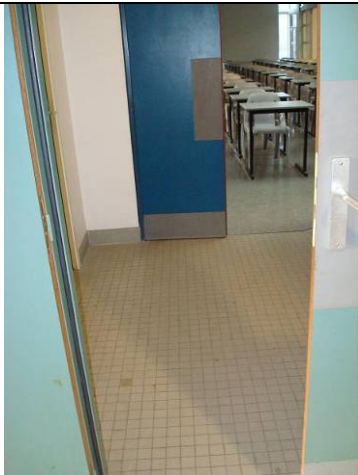
Portes salles d'examen